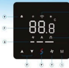
عملکرد صفحه نمایش لمسی

• نصب ترموستات را به عهده تکنسین متخصص بسپارید.