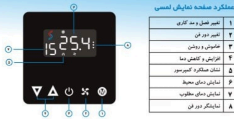
عملکرد صفحه نمایش لمسی